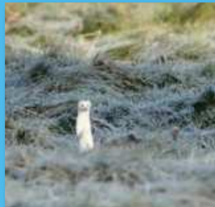
@guillaume_locatelli Hermine - 27 décembre 2024 #hermine #territoiredebelfort #grandbelfort