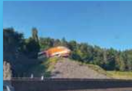
@greg_centre_ville A prototype of the TGV (1972) made by Alstom in Belfort #belfort #territoiredebelfort #grandbelfort