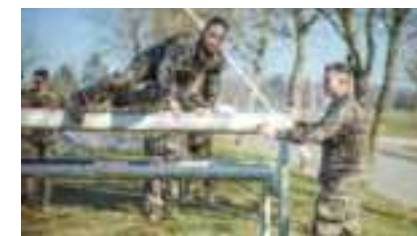
Instruction au tir à l'AK-47 d'un lieutenant du 1 er RA par un formateur roumain