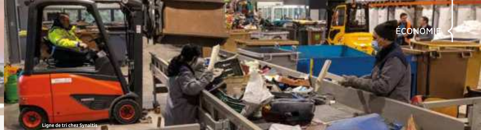
Ligne de tri chez Synaltis