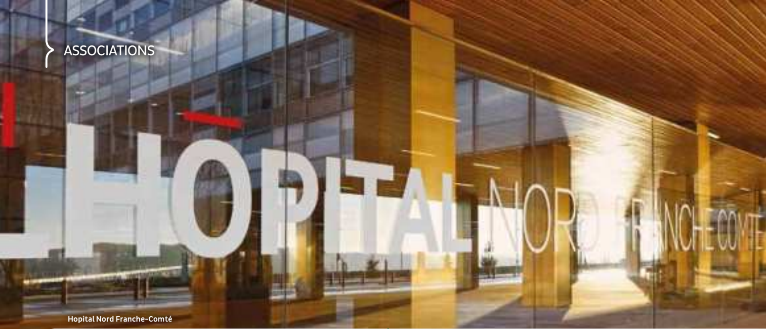
Hopital Nord Franche-Comté