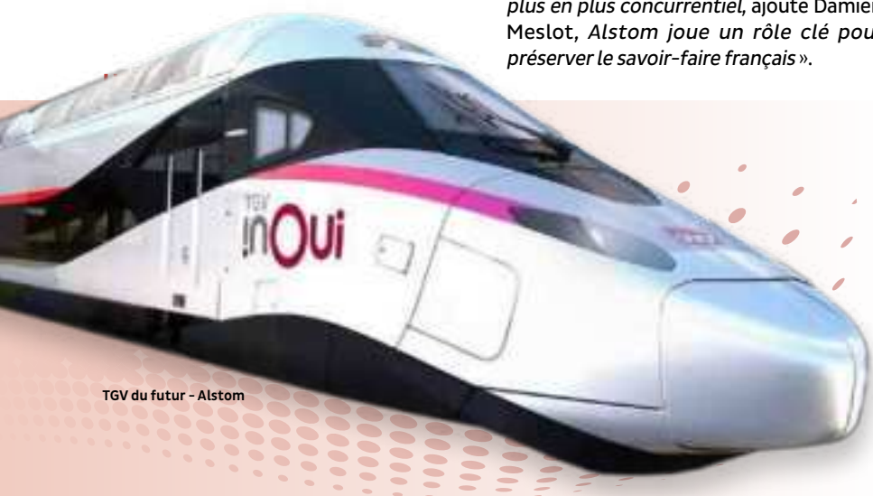
TGV du futur - Alstom

12 000 m 2 de terrain cédés par la Ville de Belfort