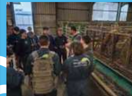
@lycéerouffach Dans le cadre de la découverte professionnelle, les élèves de troisième EA ont pu découvrir le GAEC Bellerive à Andelnans.