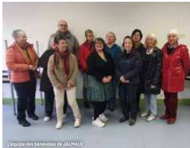
L'équipe des bénévoles de JALMALV

secretariatjalmalvfcn@orange.fr 06 65 97 69 49