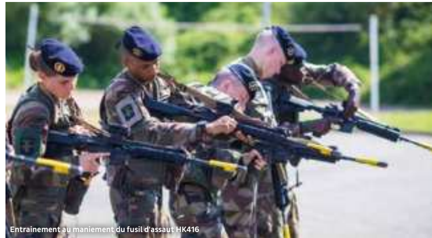
Entraînement au maniement du fusil d'assaut HK416

Installé à Belfort depuis 1873, le 35 e RI est le régiment français ayant la plus longue présence continue dans sa ville de garnison. Il compte 1 000 militaires d'active et de réserve, surnommés les Gaillards.