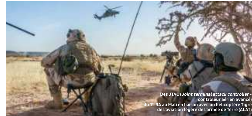
Des JTAC (Joint terminal attack controller - contrôleur aérien avancé) du 1 er RA au Mali en liaison avec un hélicoptère Tigre de l'aviation légère de l'armée de Terre (ALAT)

Depuis plus de 350 ans, le 1 er régiment d'artillerie (1 er RA) incarne la puissance de feu de l'armée française.