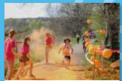
@hello_photographie90 De 2 à 77 ans venez nombreux marcher courir rire vous faire photographier le tout dans la bonne humeur.