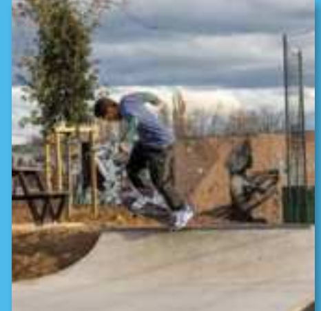
@hello_photographie90 #skatepark #grandbelfort