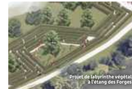
Projet de labyrinthe végétal à l'étang des Forges

Composé de 73 000 panneaux photovoltaïques répartis sur 37 hectares à l'Aéroparc de Fontaine, le parc solaire, qui alimentera la consommation électrique de près de 40 % de la population du Grand Belfort, sera inauguré en septembre prochain.