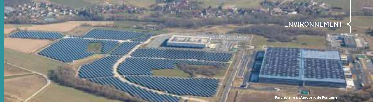
Parc solaire à l'Aéroparc de Fontaine

INFO+ Air to Go, téléchargeable gratuitement sur iOS et Android