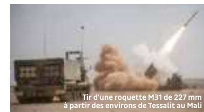
Tir d'une roquette M31 de 227 mm à partir des environs de Tessalit au Mali

Aujourd'hui basé quartier Ailleret, à Bourogne, il rassemble 750 militaires d'active. Il est rattaché à la 19 e brigade d'artillerie et reste un maillon essentiel de la défense nationale.