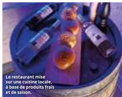
Le restaurant mise sur une cuisine locale, à base de produits frais et de saison.